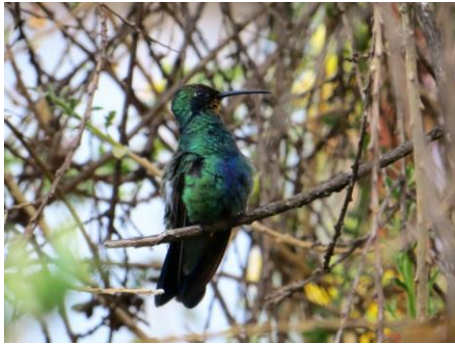
Cuando sentada se deja fotografiar más fácilmente