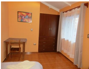
Cómoda habitación individual

Enlace para reservar (Ctrl+click): https://www.airbnb.com/rooms/11697840?