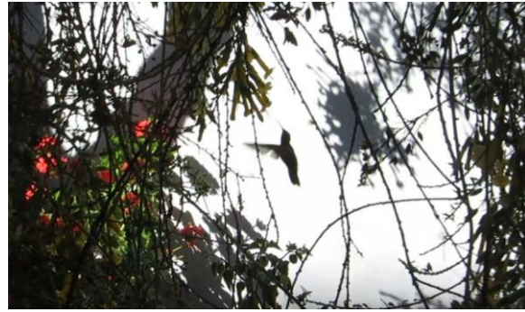
A veces, el colobri se convierte en su propia sombra