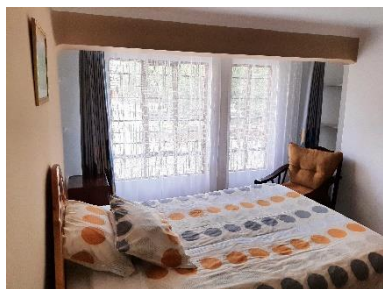
Hospitalidad y confort

Enlace para reservar (Ctrl+click): https://www.airbnb.com/rooms/11084710?