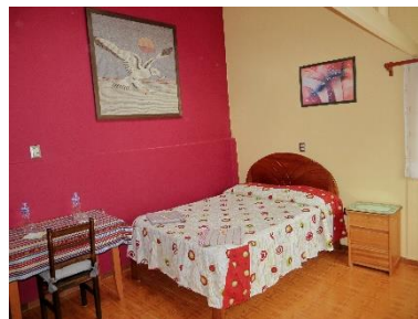
Confortable habitación doble

Enlace para reservar (Ctrl+click): https://www.airbnb.com/ro11677553oms/?